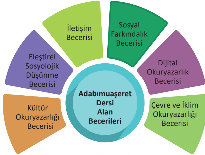
Şema 1: Alan Becerileri

Adabımuaşeret Dersi Öğretim Programı'yla öğrencilere kazandırılmak istenen alan becerileri şunlardır: